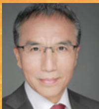
S.E. Li Xiaosi

Botschafter der Volksrepublik China in der Republik Österreich