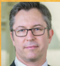
Mag. Elmar Pichl

Botschafter der Volksrepublik China in der Republik Österreich